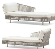
1430 Dormeuse destra base Base Right Dormeuse