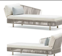
1430A Dormeuse destra CONFORT CONFORT Right Dormeuse